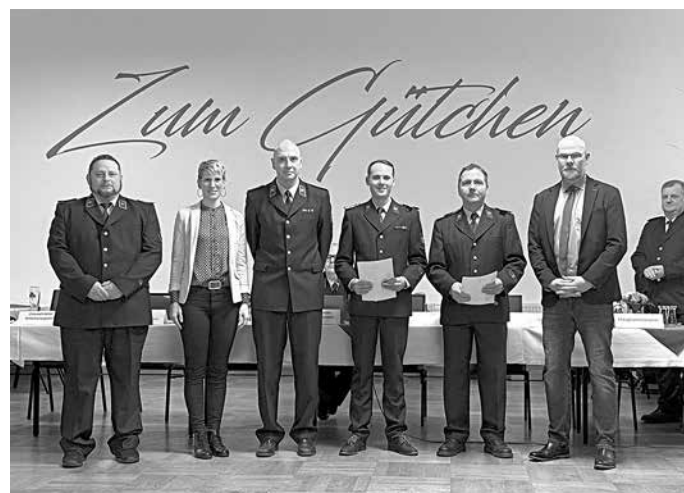
Ehrungen & Beförderungen zur Jahreshauptversammlung

Nach einer kurzen Eröffnungsrede durch den Gemeindeführer folgte das leckere Abendessen, für welches wir dem Team des Gütchens hiermit noch einmal danken.