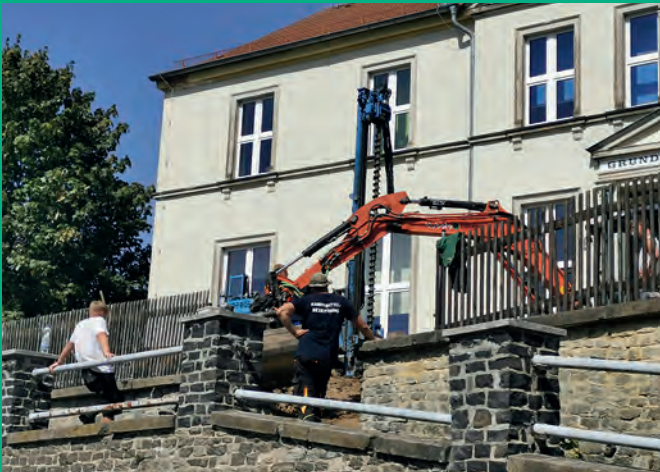
Sanierung der Schulmauer in Mittelherwigsdorf