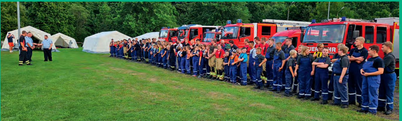
Sommerlager der Jugendfeuerwehren am Sportzentrum Mittelherwigsdorf