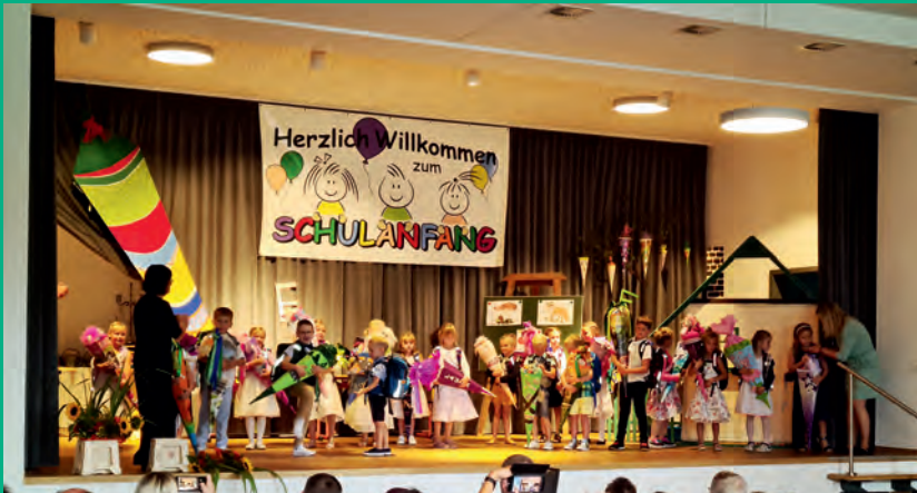
Einschulung von zwei ersten Klassen im "Gütchen"