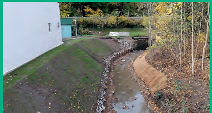
Böschungfußsicherung Eckartsbach Eckartsberg