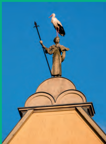
Storchenlandung auf dem Ortswächter auf dem Gemeindeviertel