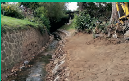
Böschungfußsicherung Eckartsbach Oberseifersdorf