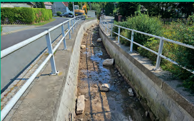
Gewässerberäumung Eckartsbach Oberseifersdorf