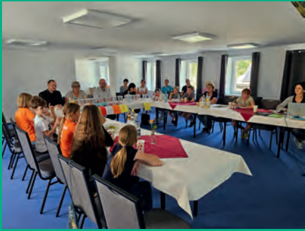
3. MITMACHherwigsdorfer Ideenkonferenz im "Gütchen"