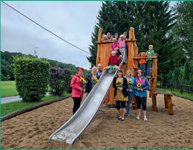
Errichtung Spielturm am Sportzentrum in Elterninitiative