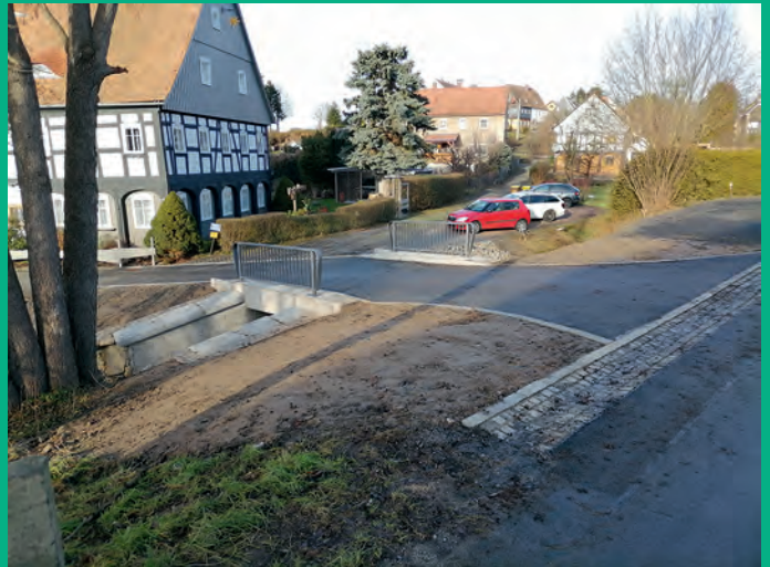
Ersatzneubau Brücke Kleine Seite 26 Mittelherwigsdorf