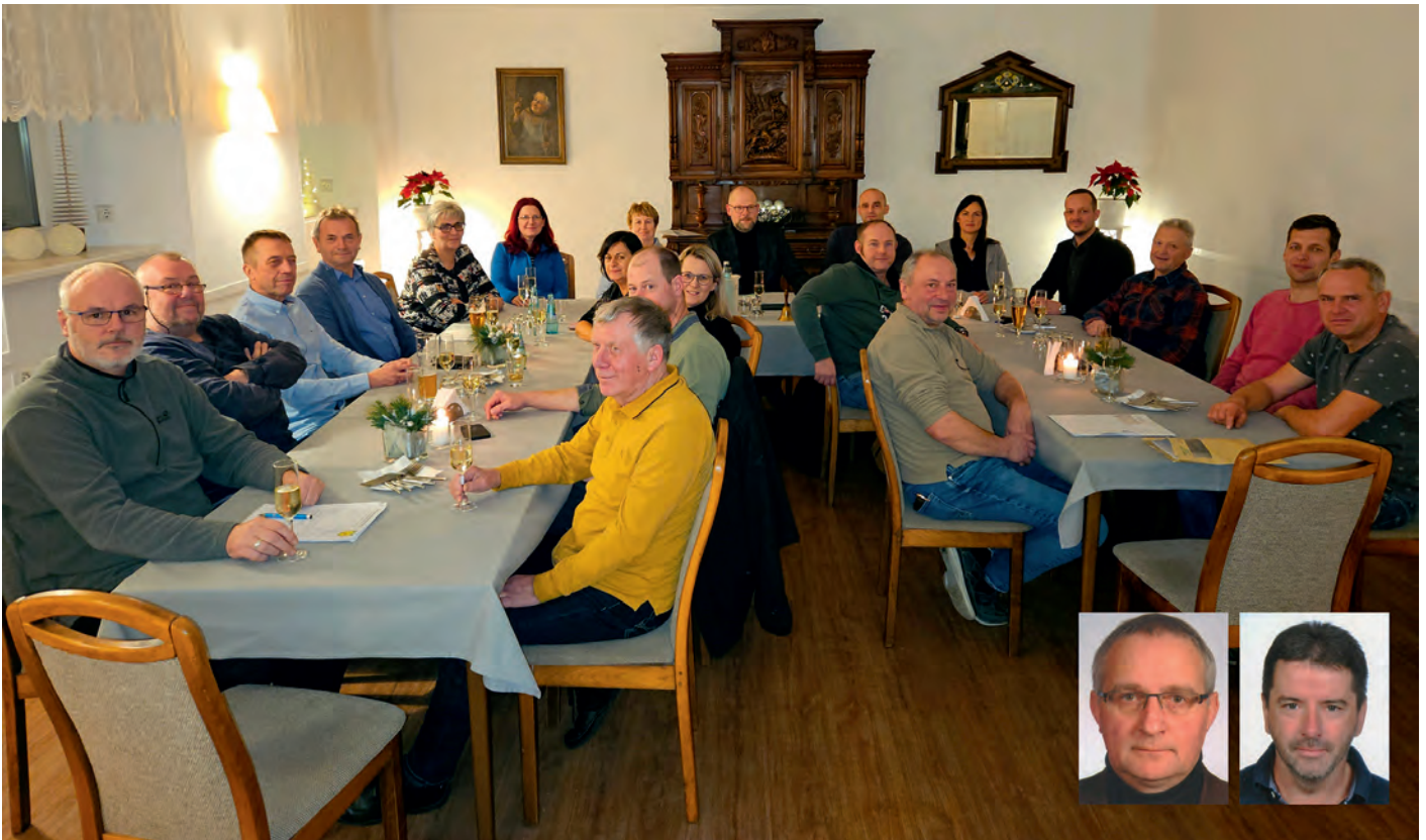
Der Gemeinderat beim Jahresausklang nach seiner Sitzung im Dezember im „Gütchen“.

Der Jahreswechsel ist vollzogen und wir freuen uns so langsam mit dem Jahr 2024 an. Im Namen von Gemeinderat und -verwaltung wünsche ich Ihnen für das vor uns liegende neue Jahr alles Gute, stets beste Gesundheit, Zufriedenheit und nie versiegenden Optimismus.