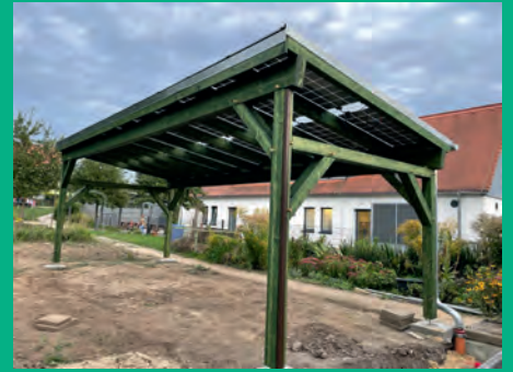
Agri-PV-Anlage im Schulgarten