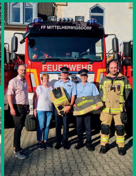
Beschaffung neuer Einsatzbekleidung für die Feuerwehr