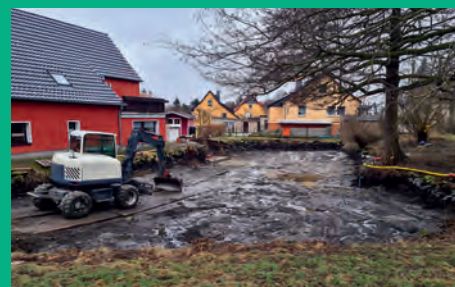
Entschlammung und Neugestaltung des Teiches Oberdorf 13 Mittelherwigsdorf