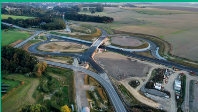
B178n-Baustelle bei Oberseifersdorf - Stand: September 2023