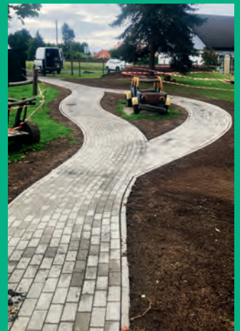
Neubau Rollerstrecke Kinderhaus Mittelherwigsdorf