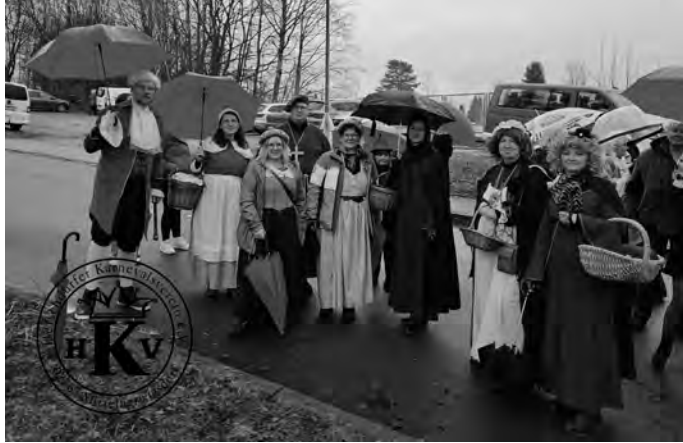
Die Gemeindeverwaltung beim Karnevalsumzug 2024 in Schirgiswalde

Hortkinder“ mit Bravour erfüllt hat, war es nun an uns, den HKV bei seiner Teilnahme am großen Karnevalsumzug in Schirgiswalde zu begleiten. Dem eher mäßigen Wetter zum Trotz, hatten wir zusammen dennoch einen schönen und ereignisreichen Sonntag in Schirgiswalde. Daher möchte ich mich beim HKV für die Einladung und vor allem bei unserer Verwaltung für die sonntägliche Begleitung herzlich bedanken. Ein Dank geht auch an die Stadtverwaltung Zittau für die Ausstattung mit den Motto-getreuen Kostümen.