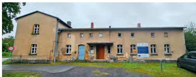
Steht zum Verkauf: Das Bahnhofsgebäude in Mittelherwigsdorf

Seit dem Herbst 2023 ist bekannt, dass sich die Deutsche Bahn mit dem Gedanken trägt, den mittlerweile leer stehenden Mittelherwigsdorfer Bahnhof zu veräußern. Voraussichtlich im April 2024 wird die Deutsche Bahn eine entsprechende Ausschreibung veröffentlichen. Wir als Gemeinde Mittelherwigsdorf sollten ein großes Interesse daran haben, die Zukunft des denkmalgeschützten Gebäudes sowie des mit zu veräußernden Grundstückes (insgesamt ca. 4.500 m 2 ausschließlich Bahnsteige und für den Betrieb relevante Bereiche) nicht dem Zufall zu überlassen. Negativbeispiele gibt es deutschlandweit und in der näheren Umgebung zu viele, als dass auch der Mittelherwigsdorfer Bahnhof als bloßes Spekulationsobjekt enden sollte. Aus diesem Grund möchten wir uns gern zu möglicherweise bereits existierenden Konzepten oder Ideen zur zukünftigen Nutzung des Objektes austauschen.