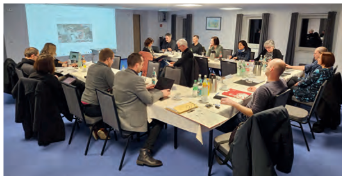
Juryberatung am 27. Februar im Tagungsraum des „Gütchen“

Am 6. März hat die Auslobungsphase zur Teilnahme am vom Gemeinderat beschlossenen Architektenwettbewerb zur grundlegenden Sanierung bzw. Neugestaltung unserer Mittelherwigsdorfer Grundschule begonnen. Geplant ist, insgesamt 12 teilnehmende Büros – so sie die notwendigen Voraussetzungen erfüllen – für den Wettbewerb zuzulassen.