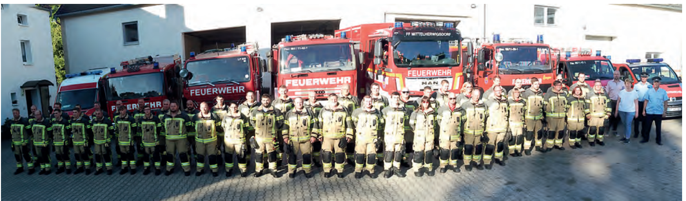
Die neu ausgestatteten Ortsfeuerwehren mit Fuhrpark zur Übergabe der Einsatzbekleidung.