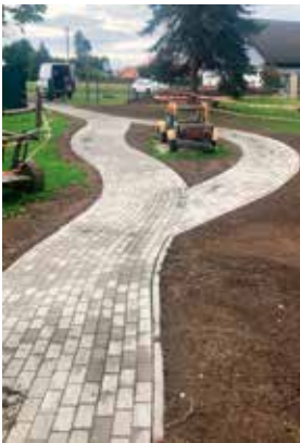
„Rollerstrecke“ Kinderhaus Märchenland

Ich hoffe, Sie hatten einen schönen Urlaub oder haben aber zumindest einige entspannte Sommertage genießen können. Auch wenn sich wohl die meisten in den zurückliegenden Wochen mal ein paar Tage Auszeit gegönnt haben, heißt das nicht, dass das Leben in Mittelherwigsdorf stillgestanden hätte.