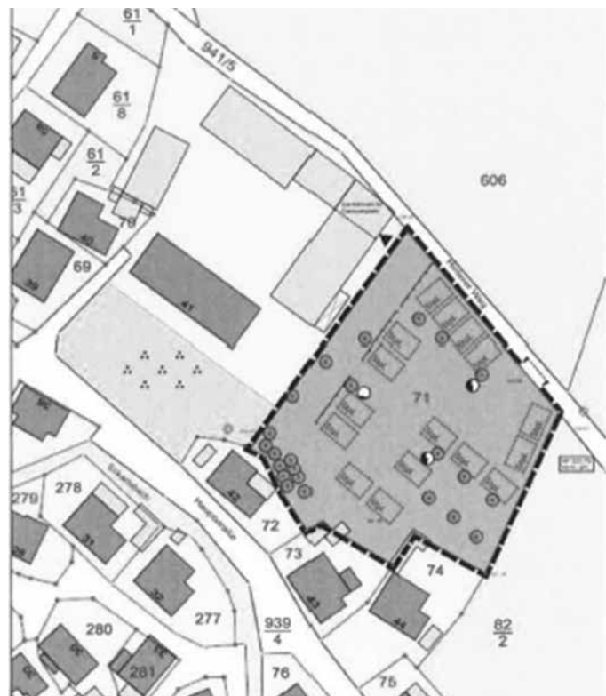
Geltungsbereich des Bebauungsplanes Nr. 15 "Caravanplatz am Schanzberg" Oberseifersdorf