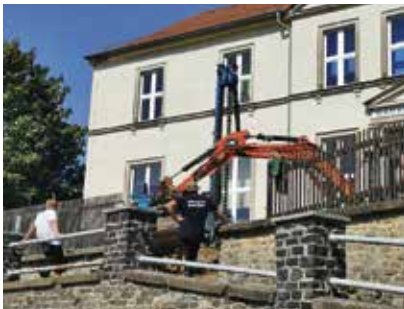
Baustelle an der Grundschule Mittelherwigsdorf

Pünktlich zum Schulstart und nach endlos langen sieben Jahren der Lösungsfindung sind die Arbeiten zur Sanierung der Schulmauer an der Mittelherwigsdorfer Hauptstraße gestartet. Die betagte Mauer war bei Straßenbaumaßnahmen im Jahr 2016 in Mitleidenschaft gezogen worden und „ins Rutschen geraten“. Mittels Spezialtiefbauverfahren sollen in einer aufwändigen Gemeinschaftsmaßnahme zwischen Landkreis und Gemeinde nun wieder ein stabiler Zustand hergestellt und eingetretene Schäden beseitigt werden. Die Maßnahme, die sich voraussichtlich bis zum Ende des Schuljahres im Juni 2024 erstrecken wird, macht eine Vollsperrung der Hauptstraße notwendig und bringt einige weitere Einschränkungen für Anwohner und Schul-Anlieger mit sich.