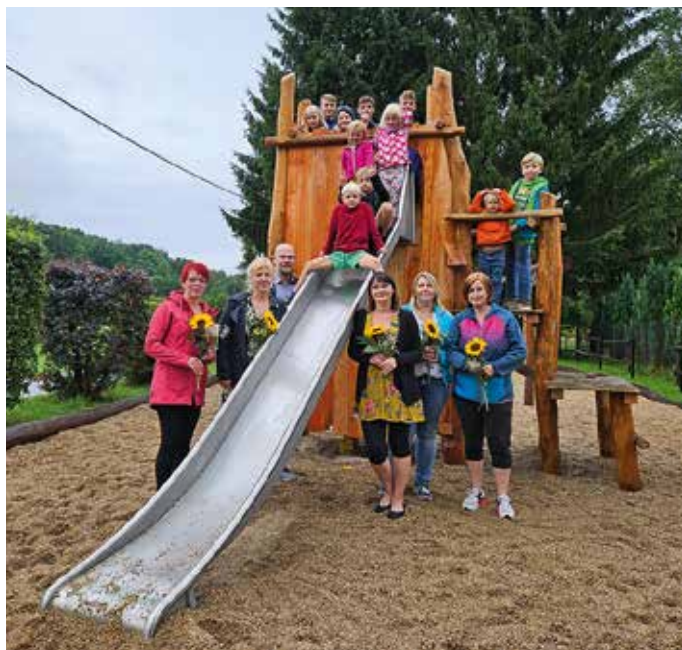
Der neue Rutschenturm am Sportzentrum mit den engagierten Müttern

In den Sommerferien wurden zusätzlich zu unseren beiden großen Maßnahmen zur Beseitigung von Hochwasserschäden aus dem Juli 2021 kleinere Maßnahmen abgeschlossen: Das Kinderhaus Märchenland hat seine langersehnte Rollerstrecke im Spielgarten erhalten, die zudem noch dafür sorgen wird, dass Kinder, Eltern und Personal auch in der feuchteren Zeit im Jahr sauberen Fußes vom hinteren Parkplatz zum Kinderhaus gelangen. Ein Abschnitt des Eckartsbaches in Oberseifersdorf wurde umfangreich von Verkrautung befreit.