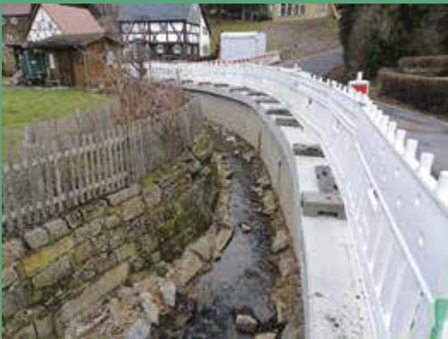
Ersatzneubau Stützmauer Am Gemeindeamt