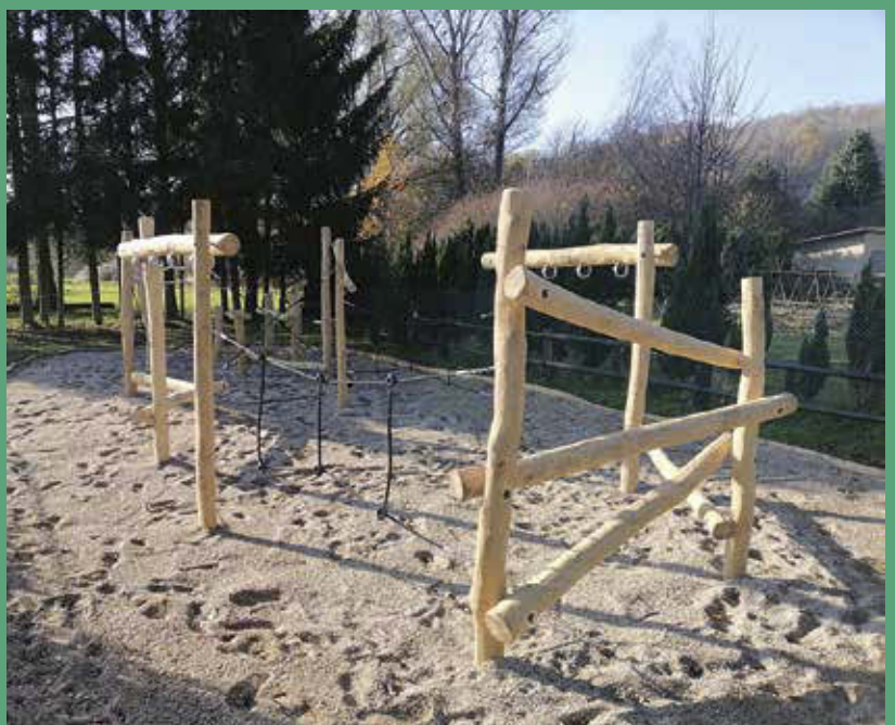
Neuerrichtung Spielplatz am Barfußweg