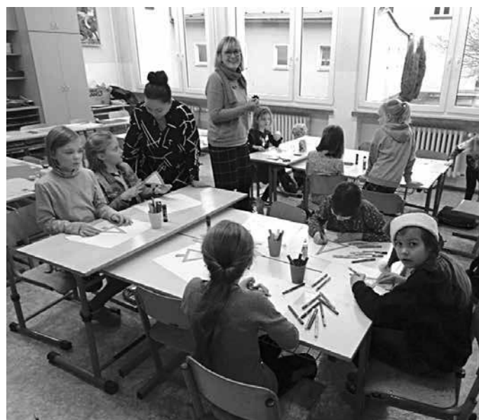
Das Team der Grundschule Mittelherwigsdorf