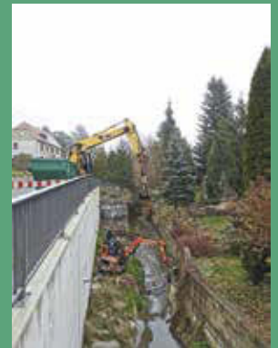
Gewässerunterhaltung am Rietschenbach in Mittelherwigsdorf