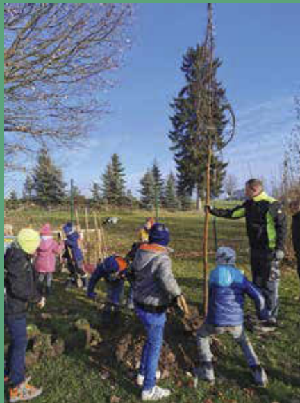
Naturparkbaumpflanzung der 1. Klassen