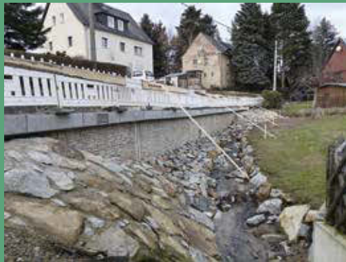
Ersatzneubau Stützmauer Kleine Seite 10-12