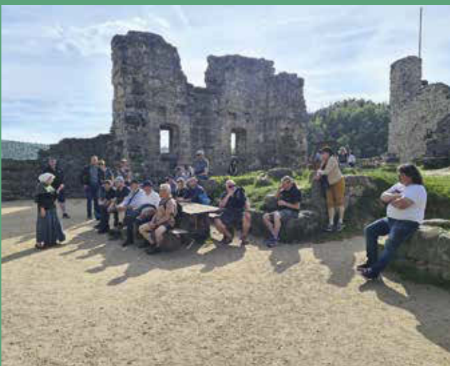
Besuch der Partnergemeinde Dischingen in Mittelherwigsdorf