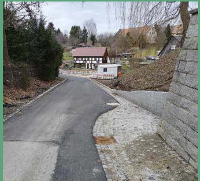
Straßeninstandsetzung Am Gemeindeamt