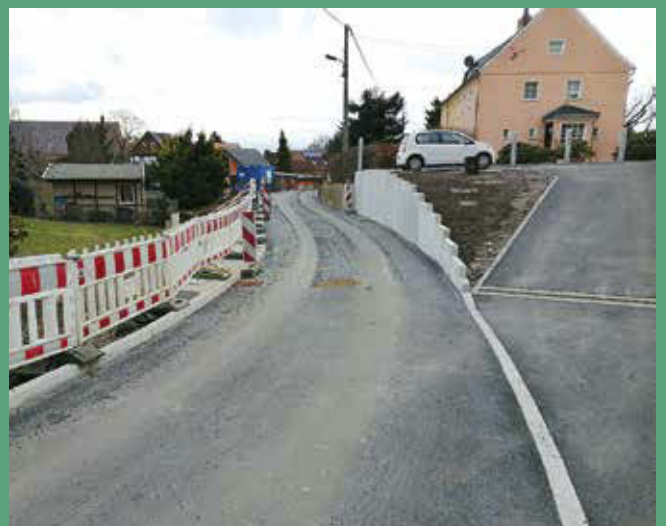
Straßeninstandsetzung Kleine Seite