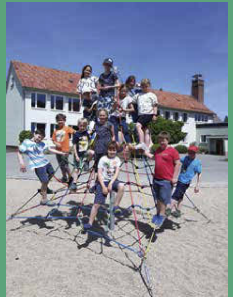
Einweihung der Kletterpyramide auf dem Schulhof