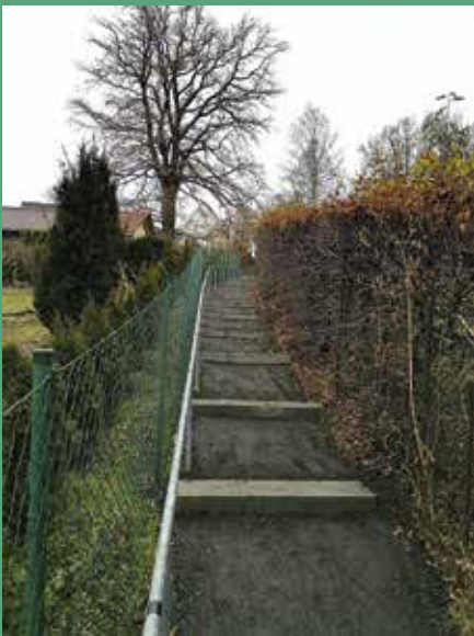
Instandsetzung Fußweg zur Neuen Straße in Eckartsberg