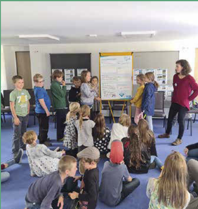
2. Kinder-Ideenkonferenz im Gütchen