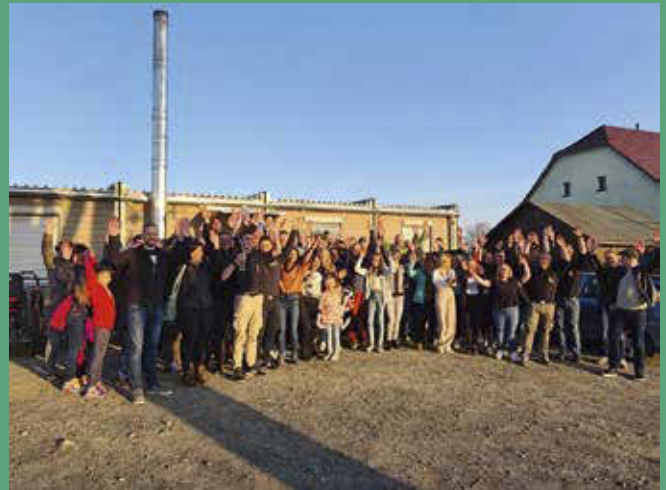
Einweihung des sanierten Jugendclub-Gebäudes in Oberseifersdorf