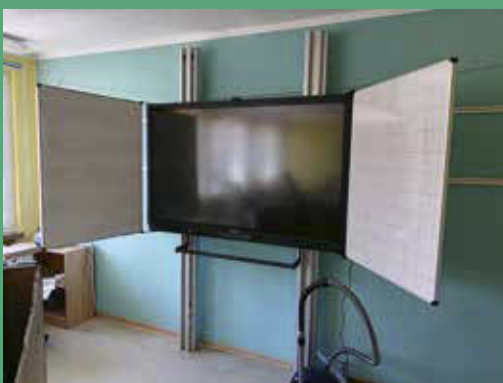
Neuanschaffung Interaktiver Tafeln für die Grundschule Mittelherwigsdorf