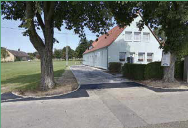
Ausbau Vorplatz am Vereinshaus Oberseifersdorf