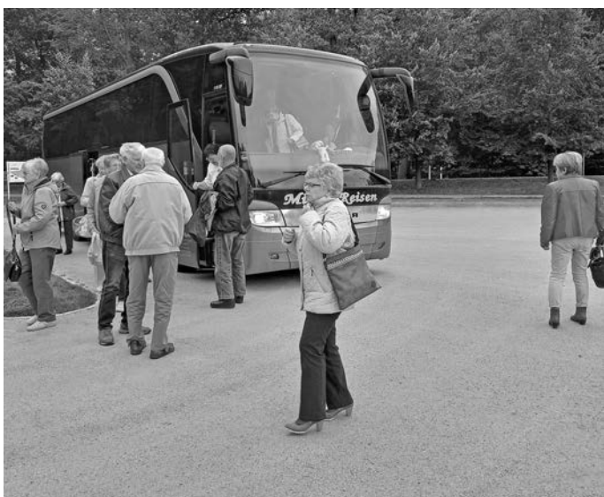
Mittag gegessen haben wir am Markt von Bad Muskau, im „Kaffee König“. Allen hat es gemundet.

Nach dem Besuch des Krommlauer Parks sind wir mit der Waldeisenbahn nach Bad Muskau gefahren. Es war eine abenteuerliche Reise. Zum Glück hatten wir noch nicht Mittag gegessen!