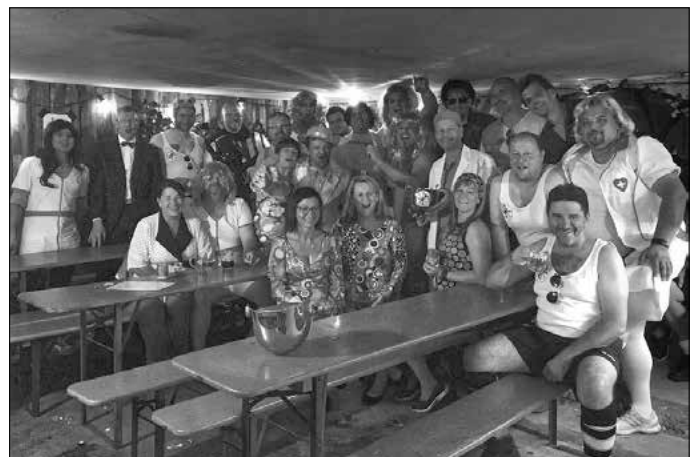
Demminger Bauernballett & Faschingsclub Oberseifersdorf