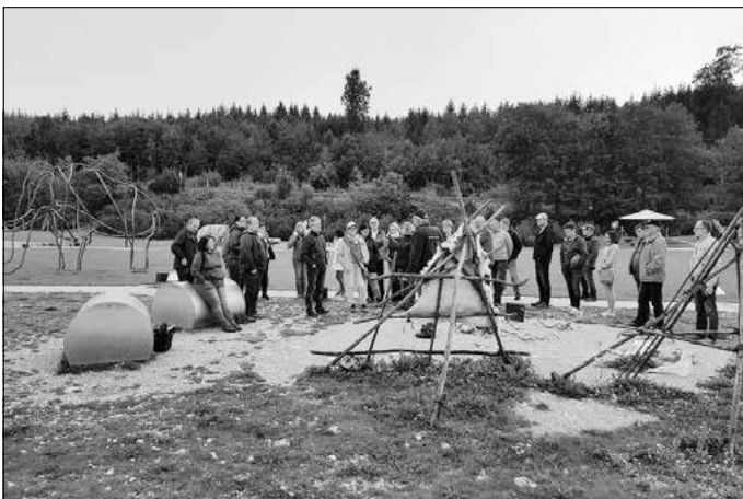
Archäopark Vogelherd Niederstotzingen

Am Sonntag erhielten wir weitere Einblicke ins reiche Dischinger Vereinsleben. Zunächst mittels Besichtigung des Stammsitzes des Faschingsvereines – Dischingen gilt als Faschingshochburg mit jährlich stattfindendem großen Umzug und fünfstelligen Besucherzahlen.