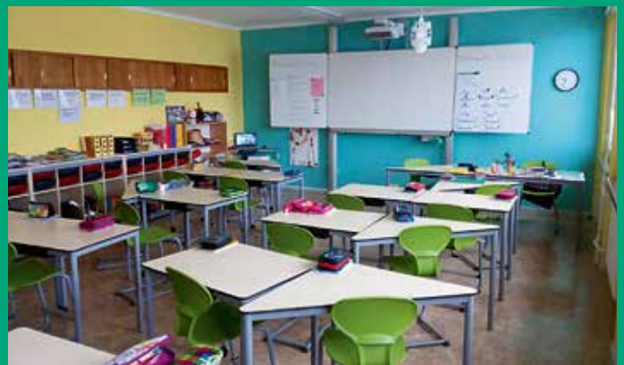
Einrichtung von 3 zusätzlichen Klassenräumen in der Schule