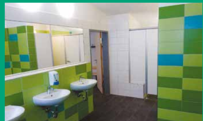
Modernisierung Sanitärräume Turnhalle