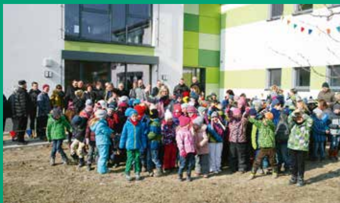
Einweihung Herschdurer Hort-Häusl (H3)