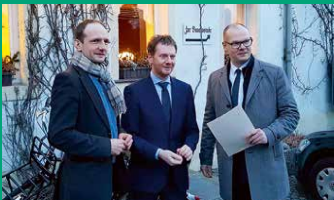
Übergabe Fördermittelbescheid Sanierung Gütchen durch Ministerpräsident Kretschmer