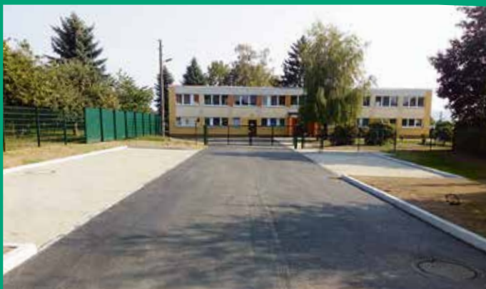
Erneuerung Zufahrt und Parkplatz Kinderhaus „Märchenland“