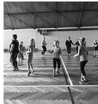
Zumba im Hort