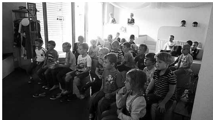
Kino im H3