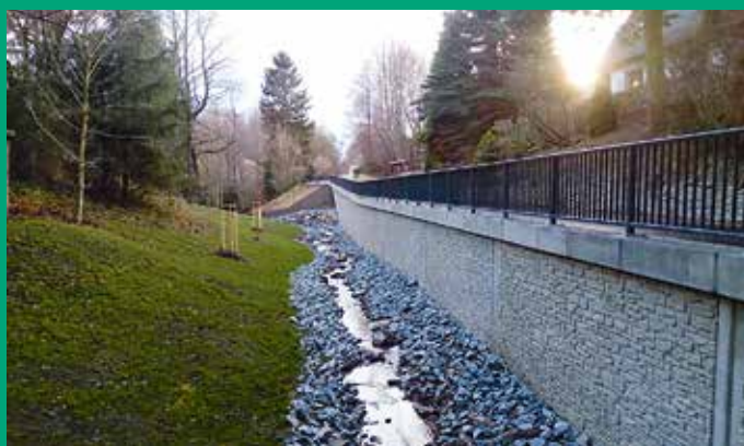
Ersatzneubau Stützmauer Kleine Seite