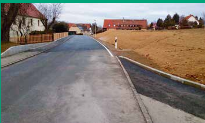
Grundhafter Ausbau Geschwister-Scholl-Straße 37–41