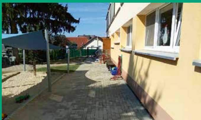
Erneuerung Außenanlagen Kinderhaus „Märchenland“