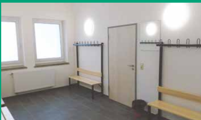
Modernisierung Umkleieräume Turnhalle