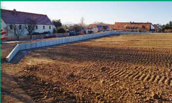
Errichtung Retentionsraum Goldene Höhe, 2. Abschnitt