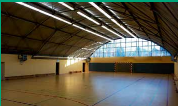
Einbau Sportboden und Prallschutz Turnhalle