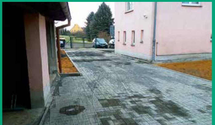
Erneuerung Außenanlagen Kinderhaus „Sonnenblume“