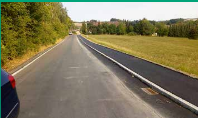
Instandsetzung Gehweg Bahnhofstraße