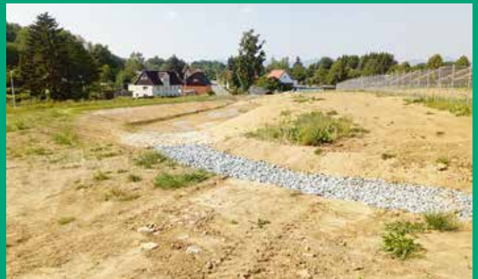
Regenwasserrückhaltebecken Gewerbegebiet Oberseifersdorf