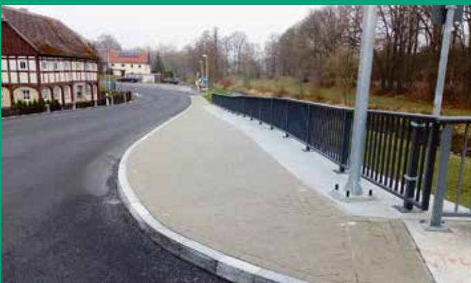
Neubau Gehweg und Ausbau Fahrbahn Hainewalder Straße