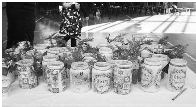
Artikel, die beim Projekttag entstanden sind