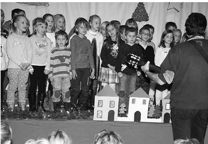
Weihnachtssingen Klasse 1