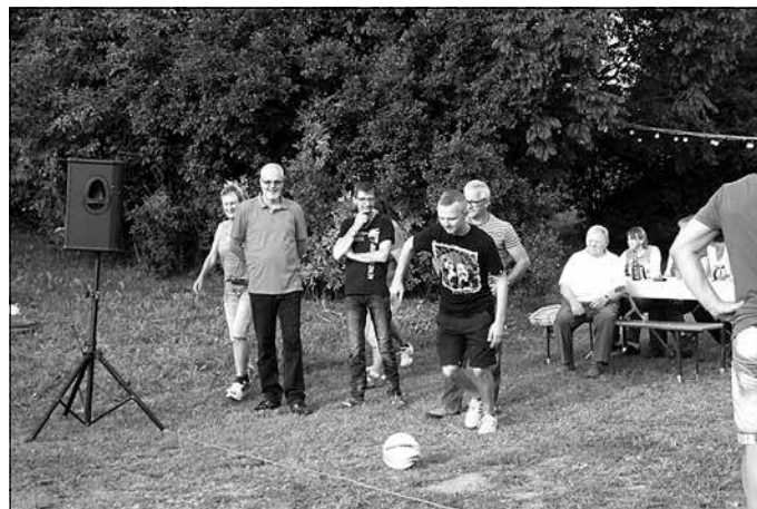
Duell beim Torwandschießen