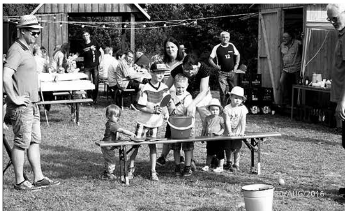
Tischtennis der etwas anderen Art

Abgerundet wurden die sportlichen Wettkämpfe von den Fußballfreunden. Diese hatten eine selbstgemachte Torwand mitgebracht. Dass dabei nicht viele Treffer zu verzeichnen waren, lag mit Sicherheit an den zwei Löchern, die nur unwesentlich größer als der Fußball selbst waren. Zum Abschluss gab es noch einen besonderen Gaudi. Die Fußballer forderten die Tischtennisfreunde zu einem kleinen Duell heraus.