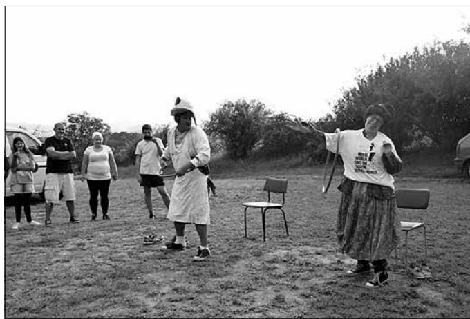
Gymnastik mit Hindernissen

Und es gelang! Wir wurden für den Mut belohnt. Auch wenn beim Aufbau am Samstagmorgen die Sonne sich noch nicht zeigte, am Nachmittag war sie da und bescherte den zahlreichen Besuchern wunderschönstes Sommerwetter. Dank hervorragender Organisation war für alles bestens gesorgt. Das Gegrillte und die selbstgemachten Salate schmeckten allen, an Durst brauchte niemand zu leiden und die musikalische Umrahmung durch Gerd Semdner hatte für alle Altersklassen und musikalische Geschmacksrichtungen etwas zu bieten. Und die durch die Sektionen vorbereiteten sportlichen Spiele machten nicht nur den Teilnehmenden, sondern auch den zahlreichen Zuschauern Spaß. Den Anfang machten die Sportfreunde der Tischtennissection „Flinke Kelle“. Das einfach erscheinende und gleichzeitig schwer zu erreichende Ziel bestand darin, einen Tischtennisball mit dem Schläger in einen Blecheimer zu befördern. Es war schon nicht einfach, den Ball in den Eimer zu bekommen. Dass aber auch einige getroffene Bälle wieder heraussprangen, sorgte für so manche Lacher.