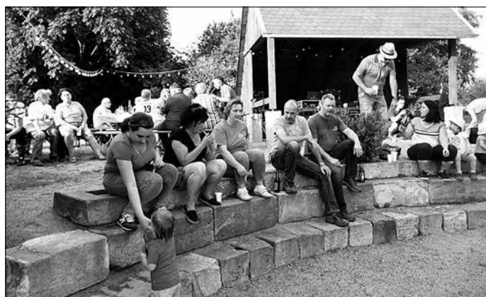
gemeinsam in gemütlicher Runde

Als nächstes veranstaltete die Sektion Gymnastik einen kleinen Gaudi mit einer Menge Klamotten und Klamauk. Zwei „Freiwillige“ mussten binnen kürzester Zeit kostümiert werden und anschließend sportliche Übungen mit Ball, Reifen und Keule absolvieren. Einen Sieger gab es hier zwar nicht, aber Spaß gemacht hat es trotzdem.