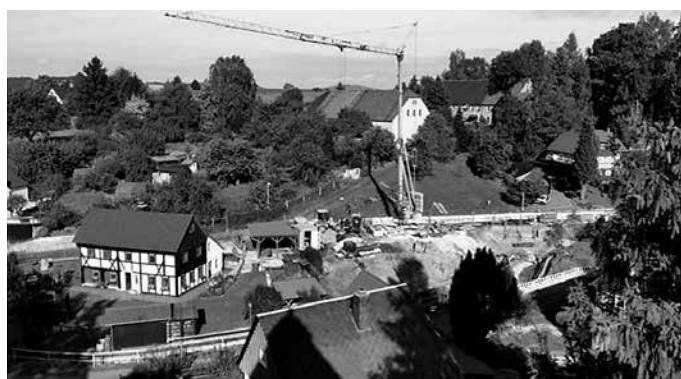
Baustelle Am Gemeindeamt in Mittelherwigsdorf

Noch mitten im Bau befinden sich die drei weiteren Hochwasser-Maßnahmen am Mittelweg in Oberseifersdorf sowie Am Gemeindeamt und der Kleinen Seite in Mittelherwigsdorf. Noch bis voraus-