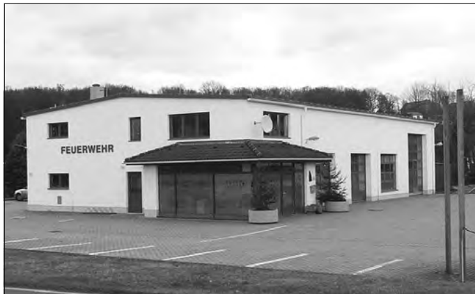
Neues Feuerwehrgerätehaus und Bauhofstandort Eckartsberg

Am 11. Januar 2014 wurde durch den Bürgermeister Markus Hallmann die offizielle Übergabe des neuen Feuerwehrgerätehauses in Eckartsberg vorgenommen. Während der Bauhof schon vergangenes Jahr die neuen Räume nutzen konnte, mussten die 30 Kameradinnen und Kameraden der Eckartsberger Wehr noch etwas Geduld aufbringen um in das neue Domizil auf der Löbauer Straße umzuziehen zu können. Grund war die Vielzahl notwendiger Umbaumaßnahmen, damit das Feuerwehrgerätehaus auch den aktuellen Standards entspricht.