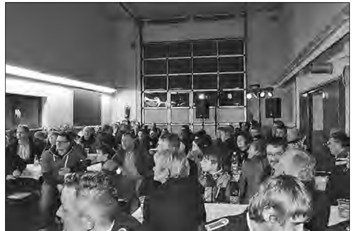
Fahrzeughalle mit Eröffnungsgästen