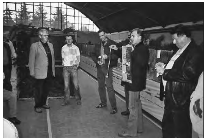
Der Bürgermeister mit Vertretern der Sondervereine bei der Eröffnung